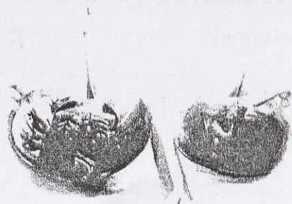
แผลงดาทะเล

ชาวบ้านมีวิธีการสังเกตว่า แผลงดาทะเลตัวโตมีพิษ โดยสังเกตจาก ด้านหน้า ใต้ท้องของเทรตัวเมียจะหักเว้ามากกว่าตัวผู้ และลำตัวที่ท้องจะมีขนรุงรัง ส่วนด้านหลังมีสีแดงดำ ตาสีแดง ผิดกับแผลงดาจาง ซึ่งมีตาสีดำ